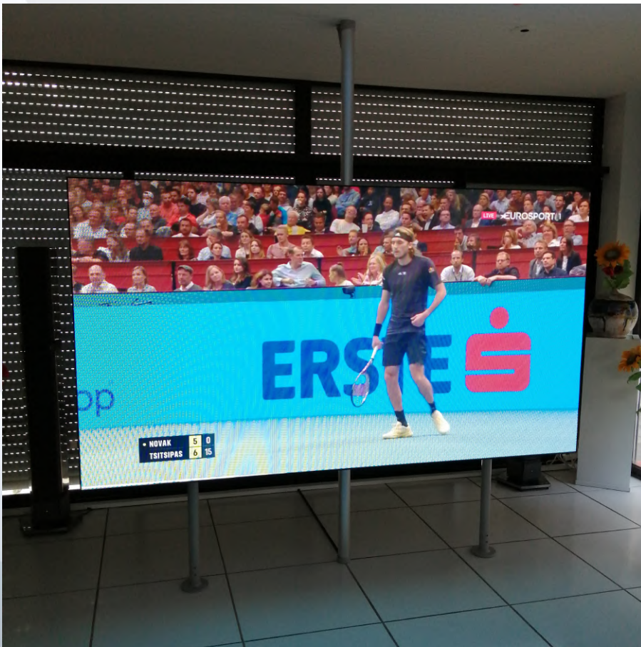
Client particulier (Toulouse)