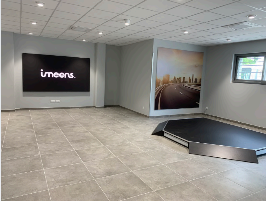
Showroom GD France (Rousset)