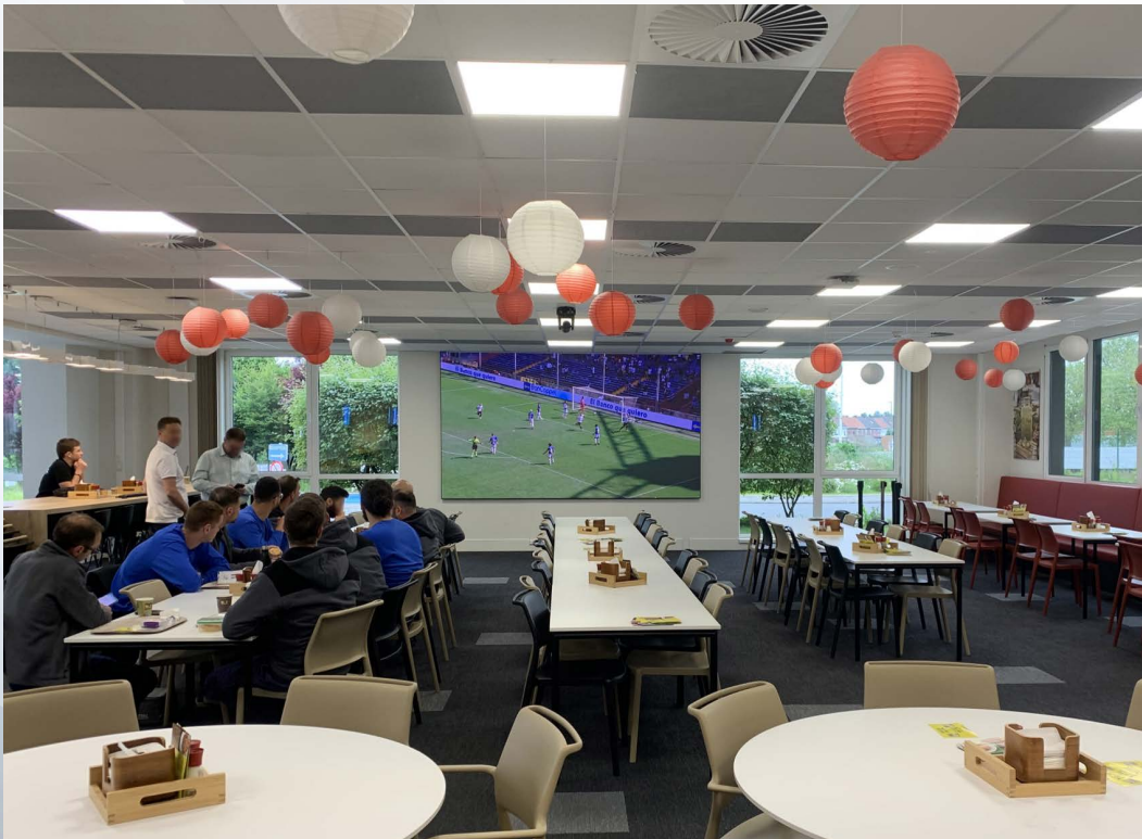
Salle de réception Takeda Pharmaceuticals Belgium