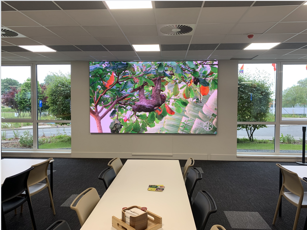
Salle de réception Takeda Pharmaceuticals Belgium